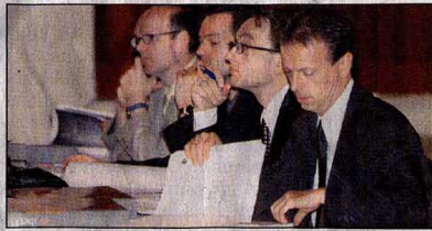
Ibet bringt öffentliche Hand und Privatwirtschaft zusammen.