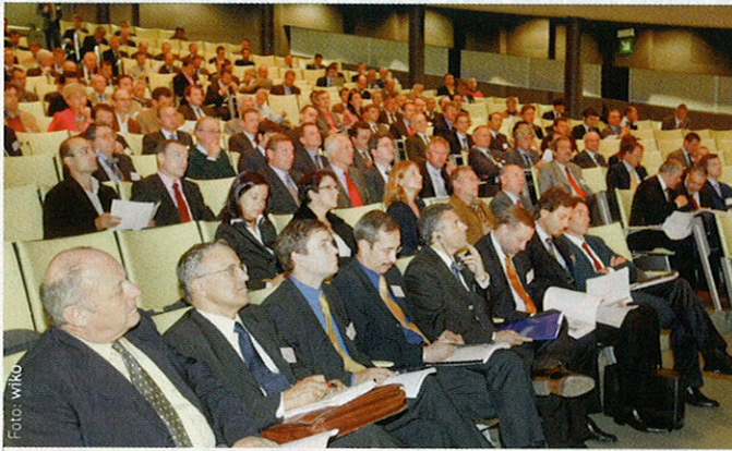
13. ibet Form in Bozen: PPP-Modelle als interessante Alternative.

Die ibet 2008 wird am 28. März in Bozen zum Thema Public Private Partnership stattfinden. Internationale Experten präsentieren erfolgreiche Praxisbeispiele und Rahmenbedingungen für das PPP-Modell, das in Südtirol noch ein Schattendasein führt. „Die ibet 2008 in Bozen soll einen Impuls für die Zusammenarbeit von Privatwirtschaft und öf-