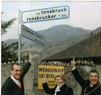
Enthüllung in Bozen